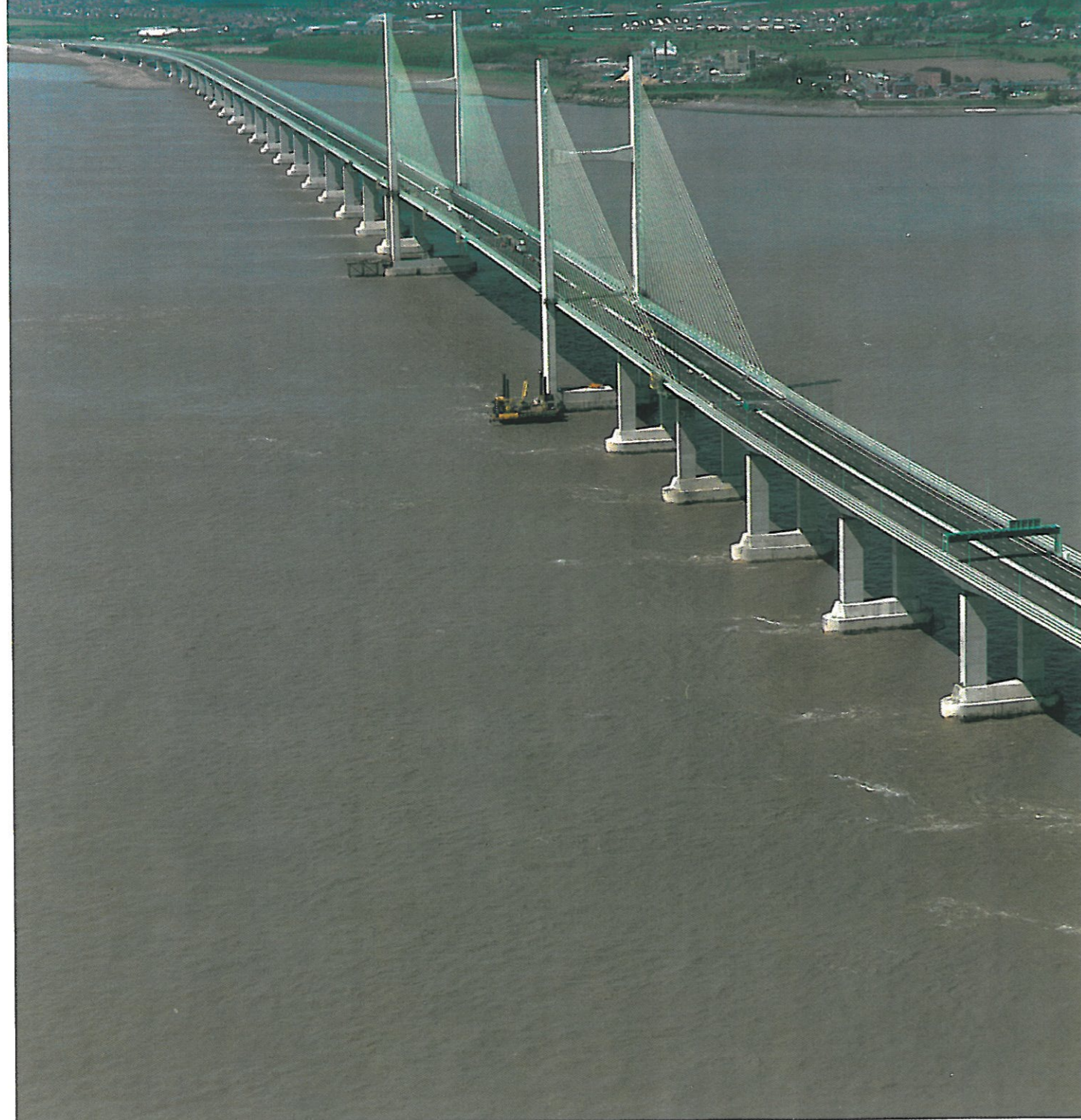
SECOND SEVERN BRIDGE